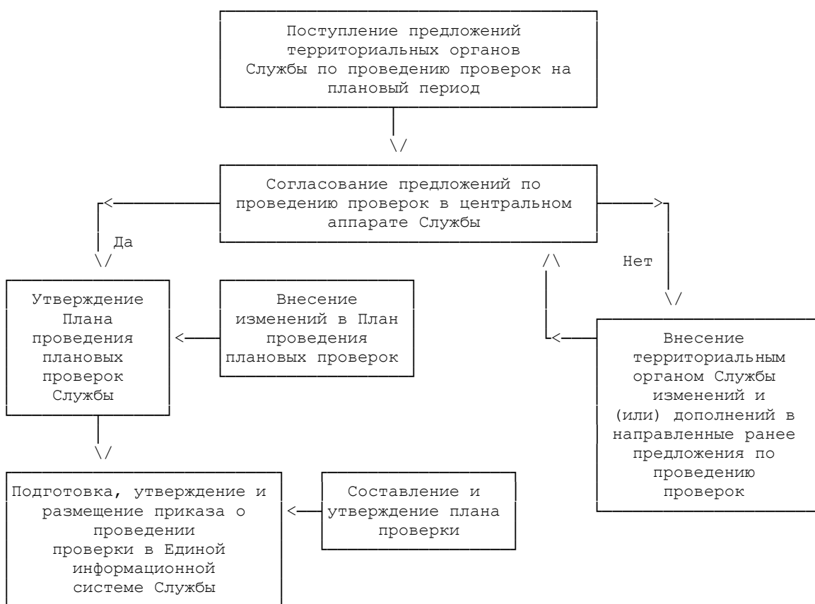
Блок-схема административной процедуры проведения проверок